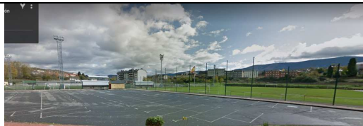
Instalaciones deportivas "El Barco"