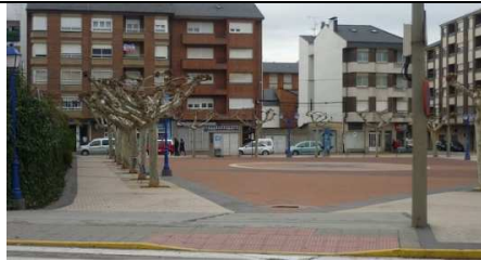
Plaza Santa Bárbara

Subida a banco. Podemos ir alternando las piernas: