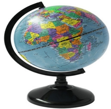
Un globo terráqueo es un modelo de la Tierra

2. ¿Qué puedes tú ver en el mapa? Escribe el nombre de los continentes u océanos.